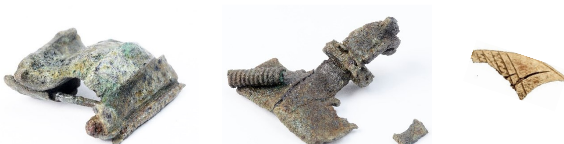
Fotot visar de fibulor som låg vid vardera sidan av kroppen tillsammans med ornerade kamfragment.

Analyserna visar att det var cirka två tusen år sedan som de ovan redovisade händelserna inträffade. Smyckena låter oss ana att den begravda var en kvinna och enligt den osteologiska analysen var hon mycket ung när hon avled. Vid begravningen var hon klädd i en klänning av ull som vid skuldrorna var uppfäst med två fibulor. Hängande runt halsen hade hon en guldglänsande berlock. Till dessa dräktattiraljer har hon fått med ytterligare två fibulor. Dessa var placerade på var sidan om höften. Intill vardera fibulan fanns även resterna efter vackert ornerade kammar. Placeringen av föremålen vid sidan om kroppen kan förstås som att de kan ha varit samlade i någon form av behållare, kanske en skinnpåse som i sin tur varit fäst vid ett bälte eller liknade.