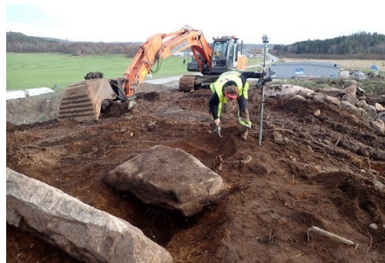
På bilderna syns de båda stenhällarna. I bilden till höger kan man även ana gravgropen mellan de två överliggande stenhällarna.

Jag nämnde tidigare den avlånga stenhällen som låg på tvärs över gravhögen. När vi grävde runt och framför allt söder om stenhällen så ändrade jorden efterhand karaktär, den blev vad vi arkeologer brukar kalla fet, det vill säga mörk och lite smörig i konsistensen. Även den stenighet som funnits i de övre lagerna avtog istället framträdde formen efter en stor grop med distinkta nedgrävningskanter. Så, en viss förhoppning fanns ändå kvar där vi slet med att avlägsna lager efter lager av jord och sten. När vi hittade en del av en kam av horn och intill denna en bronsfibula (en slags säkerhetsnål som används för att hålla uppe en klänning eller särk) höjdes pulsen en hel del. Ytterligare en stenhäll kom nu i dagen i den sydöstra delen av vad vi nu uppfattade som en cirka två meter lång grop.