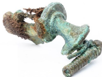
Fibula, den ena av paret som hittades intill guldbërlocken, lägg märke till de kvarvarande textilresterna.

Jag nämnde tidigare den avlånga stenhällen som låg på tvärs över gravhögen. När vi grävde runt och framför allt söder om stenhällen så ändrade jorden efterhand karaktär, den blev vad vi arkeologer brukar kalla fet, det vill säga mörk och lite smörig i konsistensen. Även den stenighet som funnits i de övre lagerna avtog istället framträdde formen efter en stor grop med distinkta nedgrävningskanter. Så, en viss förhoppning fanns ändå kvar där vi slet med att avlägsna lager efter lager av jord och sten. När vi hittade en del av en kam av horn och intill denna en bronsfibula (en slags säkerhetsnål som används för att hålla uppe en klänning eller särk) höjdes pulsen en hel del. Ytterligare en stenhäll kom nu i dagen i den sydöstra delen av vad vi nu uppfattade som en cirka två meter lång grop.