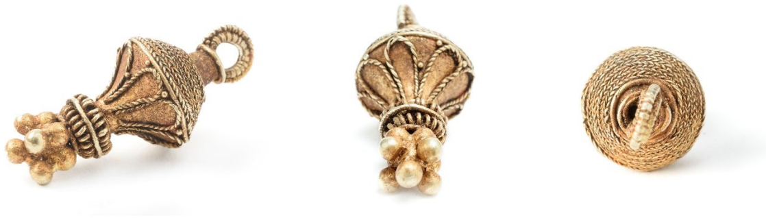
Guldberlocken ur olika vinklar.

Sent en eftermiddag när solens strålar lyste snett ner i gropen var det dags att med hjälp av grävmaskinens gripklo lyfta bort de båda stenhällarna. Under den södra hällen hittade vi ytterligare två fina bronsfibulor och mellan dem en otroligt vacker guldberlock. Att guld är en ädel metall märks inte minst på att den var helt opåverkad av tidens tand, lika guldglänsande som den måste varit då den hängde runt halsen på den person som hade burit den och som fått den med sig i graven. Fynd av tänder och ben, i detta fall obrända, fanns intill smyckena. Att benen var obrända innebar att den individ som hade gravlagts här inte hade kremerats. Det hela var mycket märkligt, att det i samma grav fanns obrända benrester efter en gravlagd individ tillsammans med kremerade människorben.