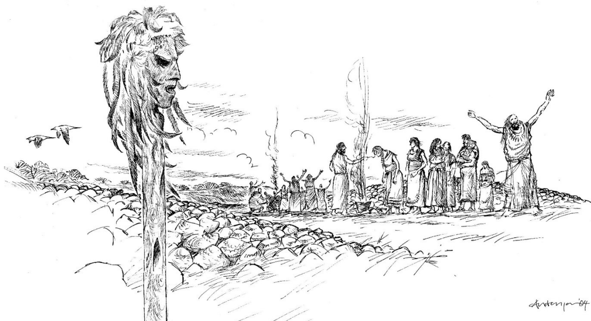
Illustration Anders Andersson.

Foss socken i Munkedals kommun i Bohuslän